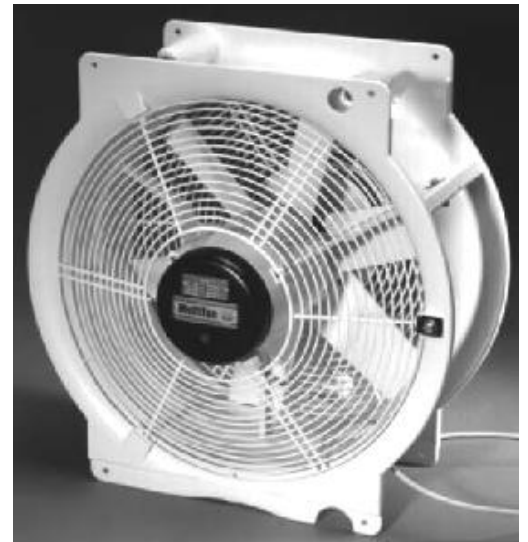
Ventilator zur Installation

(Zur optimalen Nebelverteilung wird die Anordnung der Ventilatoren im Raum von Pfalz Tec festgelegt)