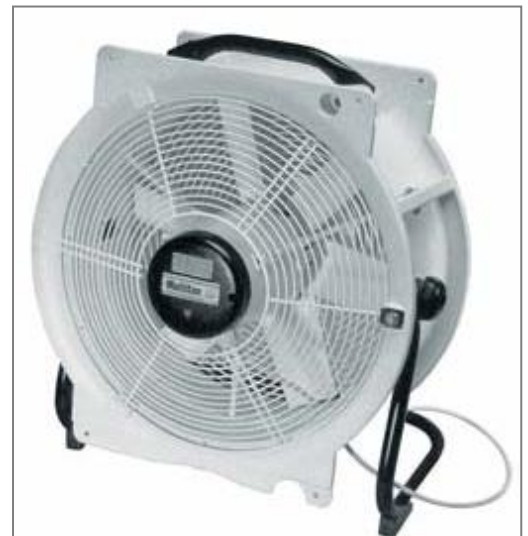
Tragbarer Ventilator mit Bügelständer und Tragegriff, 3 m Elektrokabel + Stecker 230 V